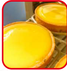
Tartes au citron