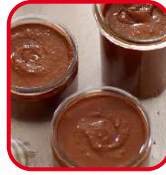
Pâtes à tartiner