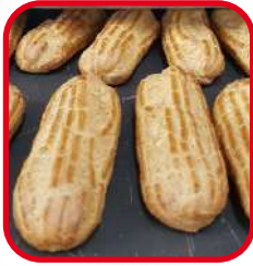
Pâtes à choux