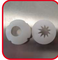
Douille lisse et cannelée