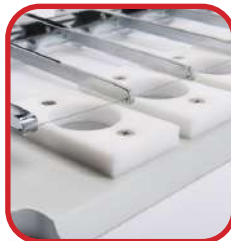
Règle pour coupe fil 6 sorties