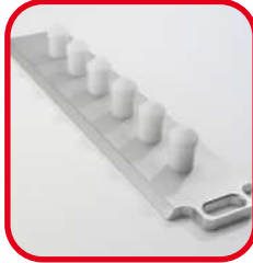
Règle fixe 6 sorties