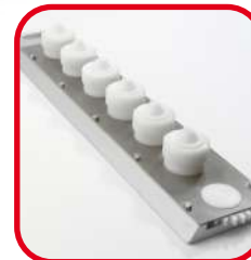
Règle rotative 6 sorties