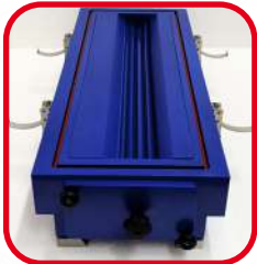
Kit pâtes molles