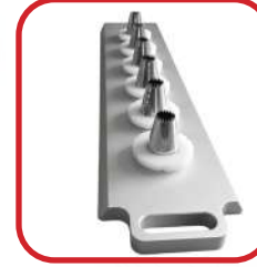
Règle avec douilles inox