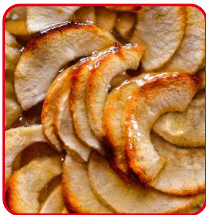
Tartes aux pommes