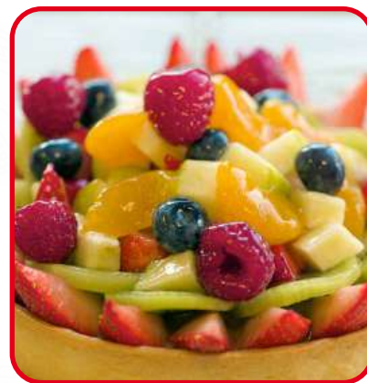
Tartelettes aux fruits