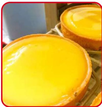
Tartelettes au citron