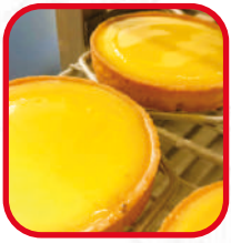
Tartes au citron