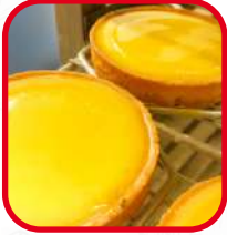
Tartes au citron