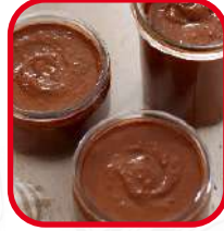
Pâtes à tartiner