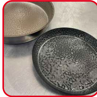
Agent de démoulage