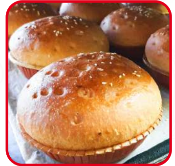
Burgers / Buns