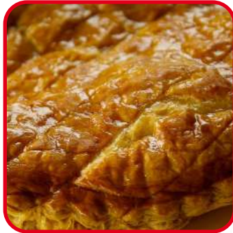
Galette des rois